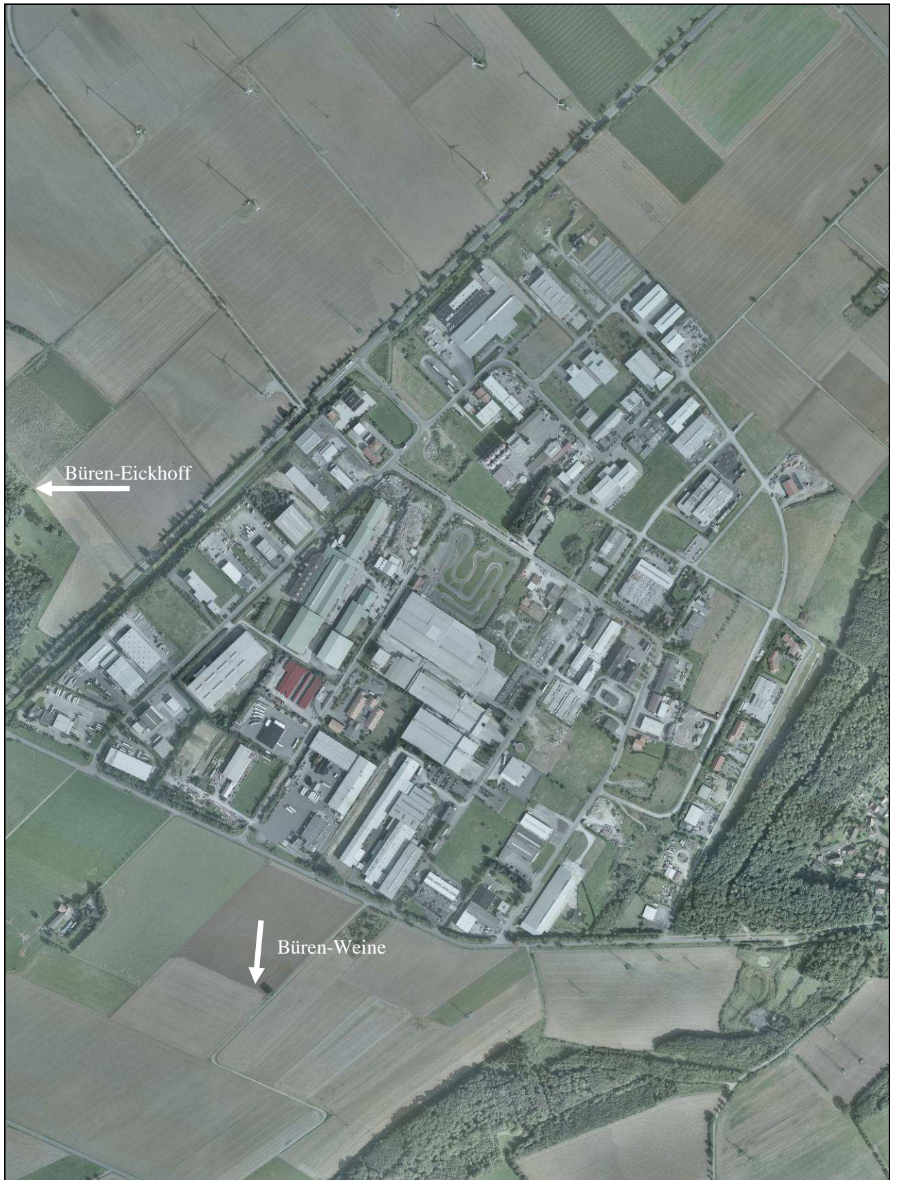
Abbildung 3: Luftbild vom Industriegebiet Büren-West