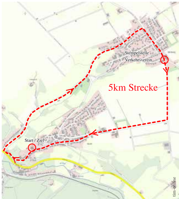
Strecke ist Kinderwagentauglich

Parkplätze sind ausgewiesen. Bitte der Beschilderung folgen!